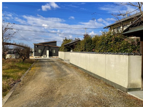
南側の雑種地 (314㎡) も含めて販売致します。