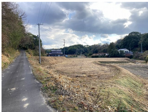
上下水道の引込なし 農業振興地域