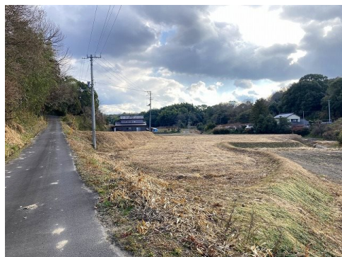
上下水道の引込なし 農業振興地域