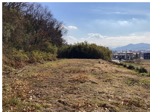
上下水道の引込なし（敷地内に井戸あり） 崖条例に抵触する恐れあり