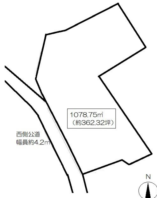
※図面と異なる場合は現況を優先致します。

現況と異なる場合には現況を優先します。 該当物件が建築条件付き宅地だった場合、土地売買契約締結後3カ月以内に売主と住宅の建築請負契約を締結していただくことを条件として販売いたします。 この期間内に住宅を建築しないことが確定したとき、または住宅の建築請負契約が成立しなかった場合は、土地売買契約は無効となり、 受領した金額は全額無利息でお返しします。